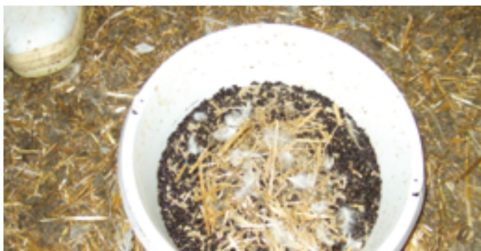
Résultats du piège TENEDROP®