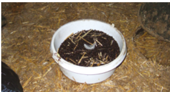
Résultats du piège TENEDROP®